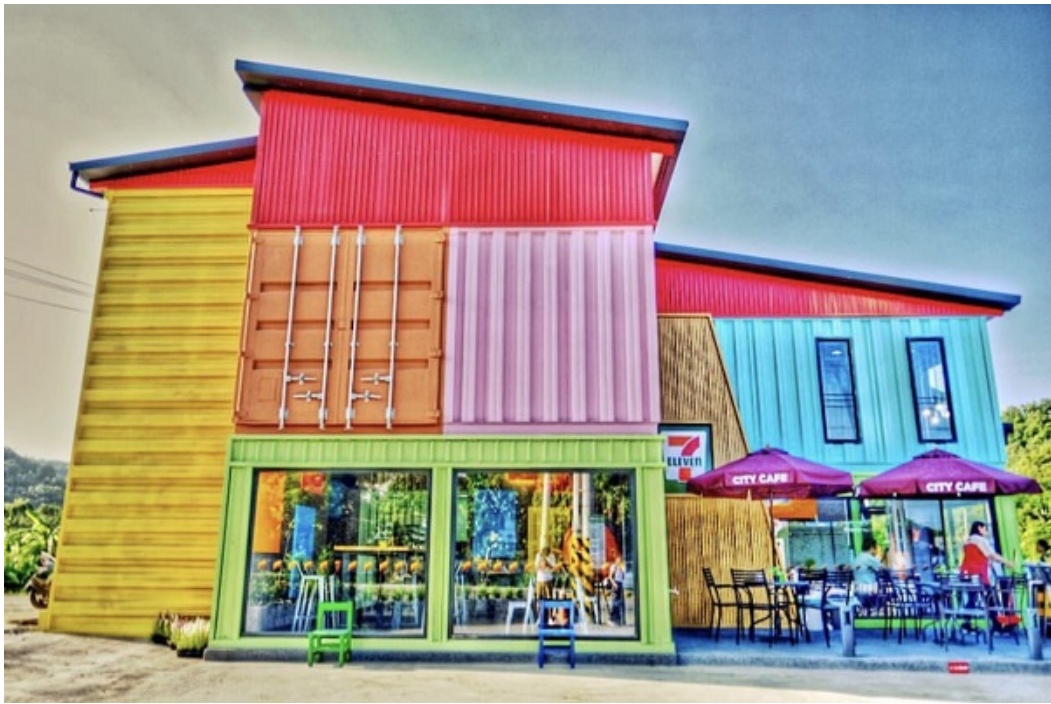
7-11 繽紛貨櫃屋非常特別，吸睛度超高。