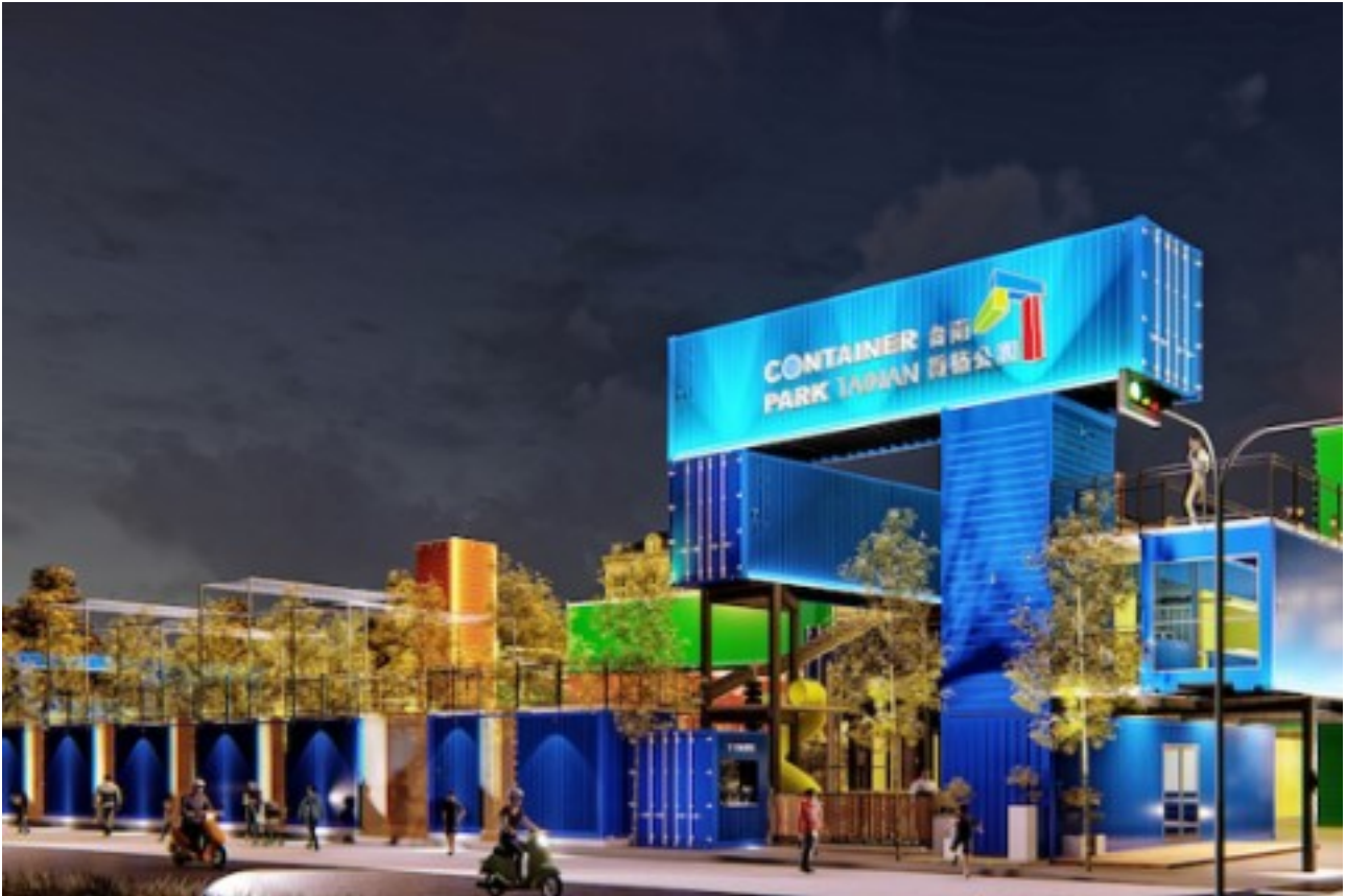
由 40 個貨櫃屋所組成的貨櫃屋樂園。

位於台南永大夜市旁的台南貨櫃公園，占地 640 坪，是由 40 個貨櫃屋堆疊而成，；園區內分為四大區域，有教育中心、建築設計中心、兒童天地與美食街。主打親子樂園的兒童天地，設有繩索大冒險、卡丁車、轉轉溜滑梯、滑草坡、草紅攀岩場、立體迷宮等，讓孩童能在安全的環境下自在的活動，鍛鍊肌肉、平衡身體發展。