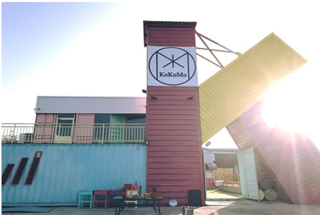
KokoMo 私房惑櫃用粉色貨櫃拼出字母K的造型。

KokoMo 私房惑櫃，將馬卡龍粉色系的貨櫃，拼成大型的英文字「K」，是門口必拍的地標景色，園區內不僅有繽紛粉色系貨櫃，還有玩偶兒童區、純白浴缸等超多好拍造景。