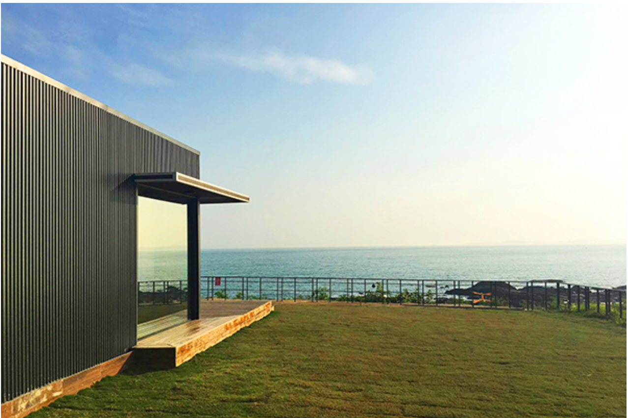
黑屋海景咖啡廳。

位在金門的黑屋咖啡海景手作廚房，是當地第一間海景咖啡館，全黑的貨櫃屋改建，就位在 IG 熱門的新湖漁港附近，獨特的外觀與舒適的室內裝潢，再加上寬廣的海景視野，相當適合旅客前往，可以一邊享用咖啡與甜點，一邊欣賞壯麗海景。