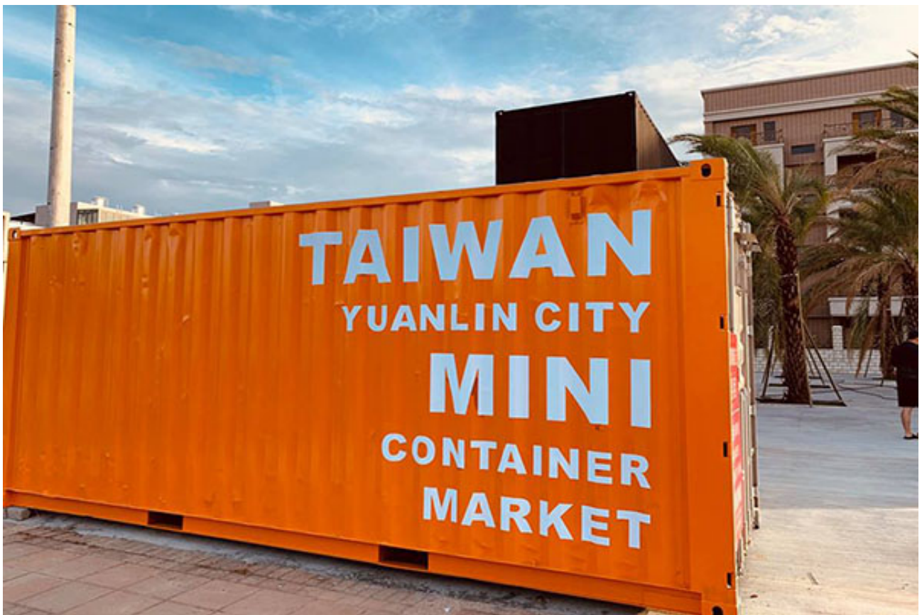
Mini Container Market 員林貨櫃市集。

Mini Container Market 員林貨櫃市集為全新的餐飲貨櫃市集，目前共進駐 5 家餐飲業者，每一家的貨櫃店面都各有不同風格，有的有少女心網美風格，有點走工業酷帥風格，每棟貨櫃屋都是打卡亮點。