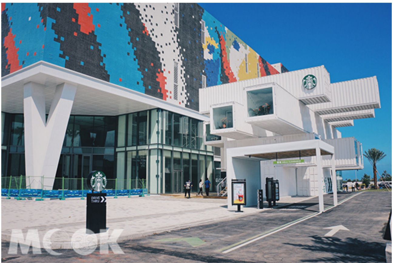
位於花蓮河瀾的星巴克貨櫃門市。

星巴克河瀾門市，運用貨櫃屋交疊設計，空處以大面積的採光天窗，讓日光層層灑落，如陽光穿透樹林般，徜徉在自然中啜飲咖啡，呼應了花蓮作為大自然特別眷顧的地方特色，享受特別的咖啡體驗。