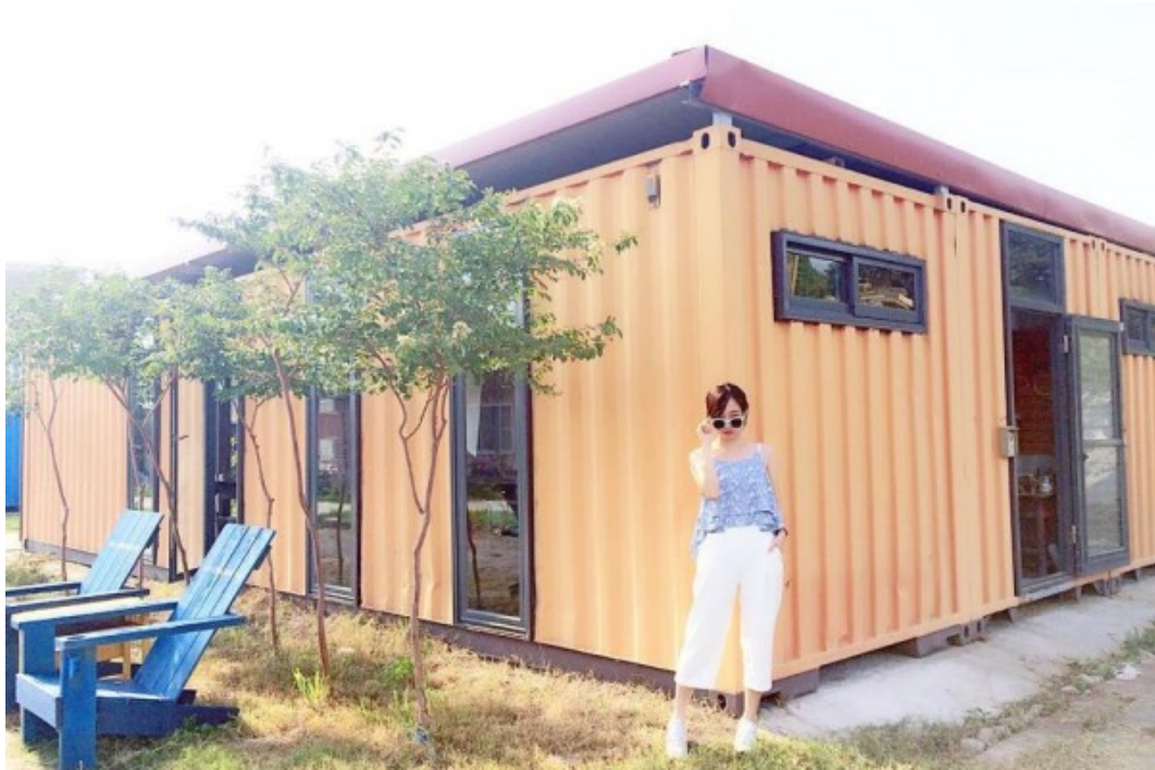
可愛的粉色系貨櫃屋都是由舊的鐵皮屋改建而成。