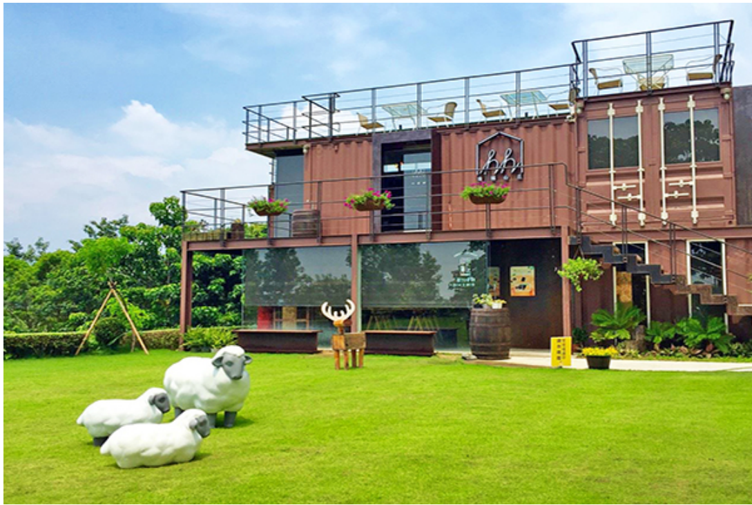
擁有無敵夜景與開闊視野的幸福山丘。(圖／幸福山丘)