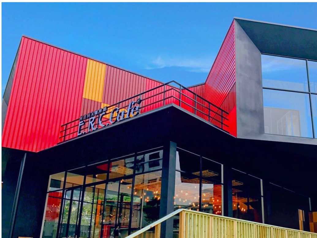
阿達阿永咖啡廳，是運用貨櫃屋建造的景觀餐廳。

利用貨櫃屋打造出充滿建築美學的用餐環境，吸引許多遊客爭相前往。除了內湖的透明玻璃貨櫃屋咖啡廳外，於新北永和區再次打造全新貨櫃屋亮點，宛如飯店大廳的內部裝潢，搭配搶眼的紅色貨櫃外觀，超級好拍。