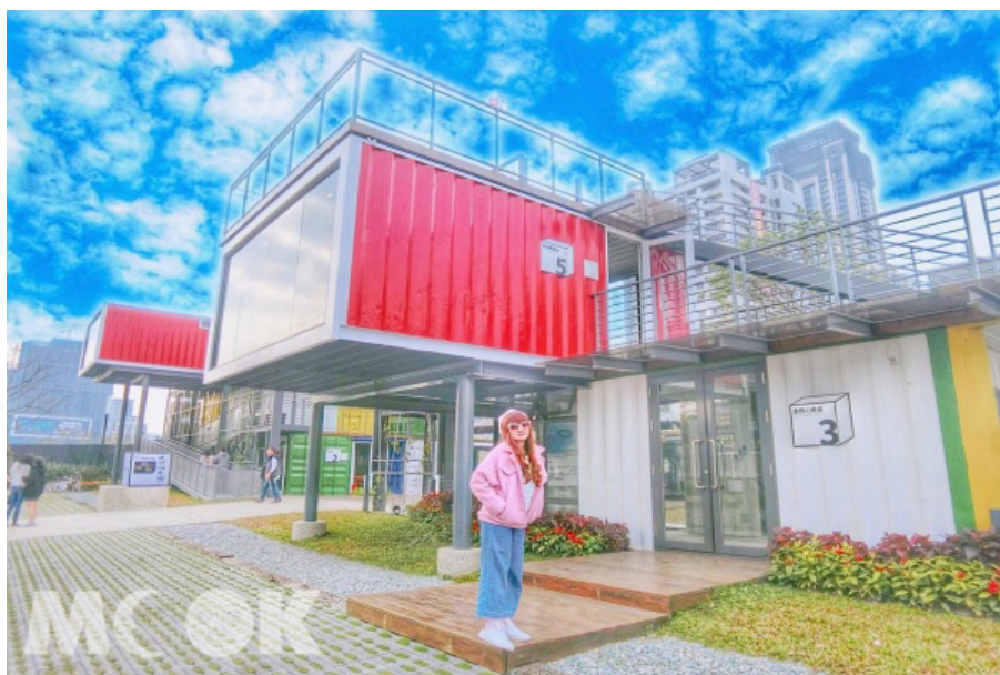
新莊日日心塾彩色貨櫃屋。

日日心塾新莊創意基地以貨櫃再利用的方式，為新莊地區打造充滿創造力的藝術空間，展現都會多元面貌的創意生活，這處結合藝文、公益、咖啡即彩色貨櫃屋建築的秘密基地，遊客們可以來一趟新莊地區，感受繽紛五彩的氣息。