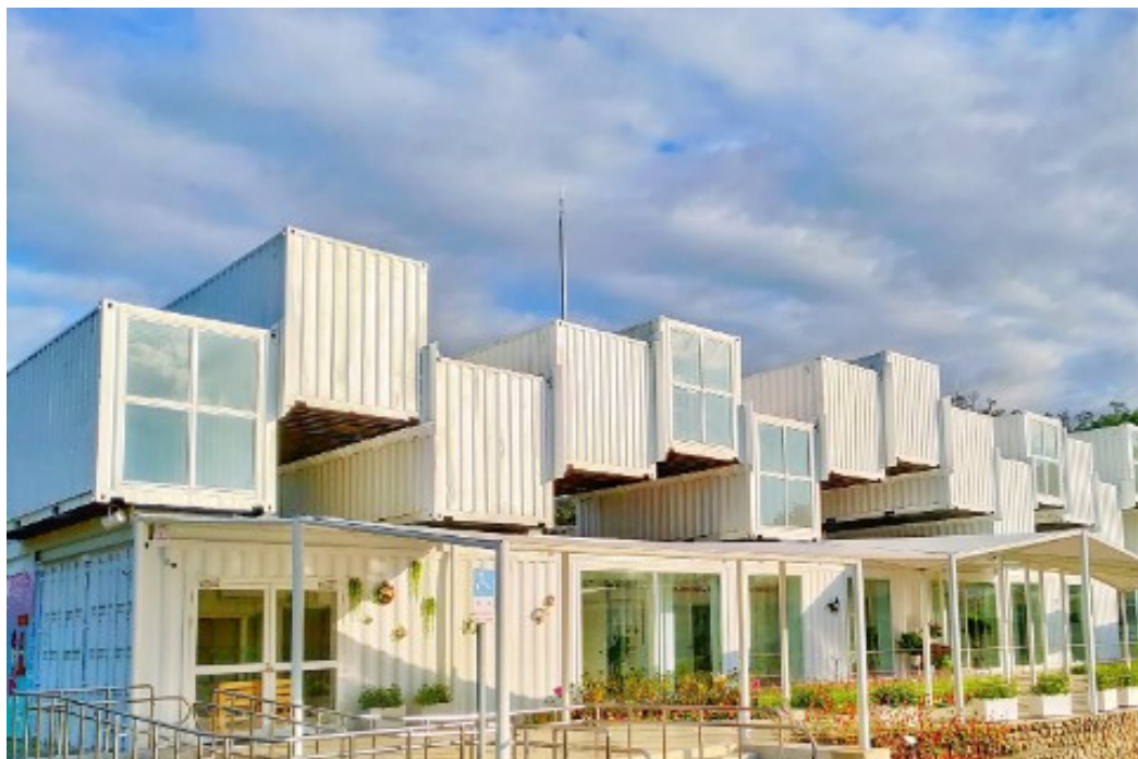
由 73 個白色貨櫃屋組成的波浪建築。

園區利用了共 73 個純白貨櫃組成波浪狀巨型建築，好天氣藍天白雲下超療癒，園區內結合了咖啡廳、觀光工廠，還打造了 11 公尺高的觀景台，能一覽龍潭湖畔風光景緻，帶孩子來放電超方便。