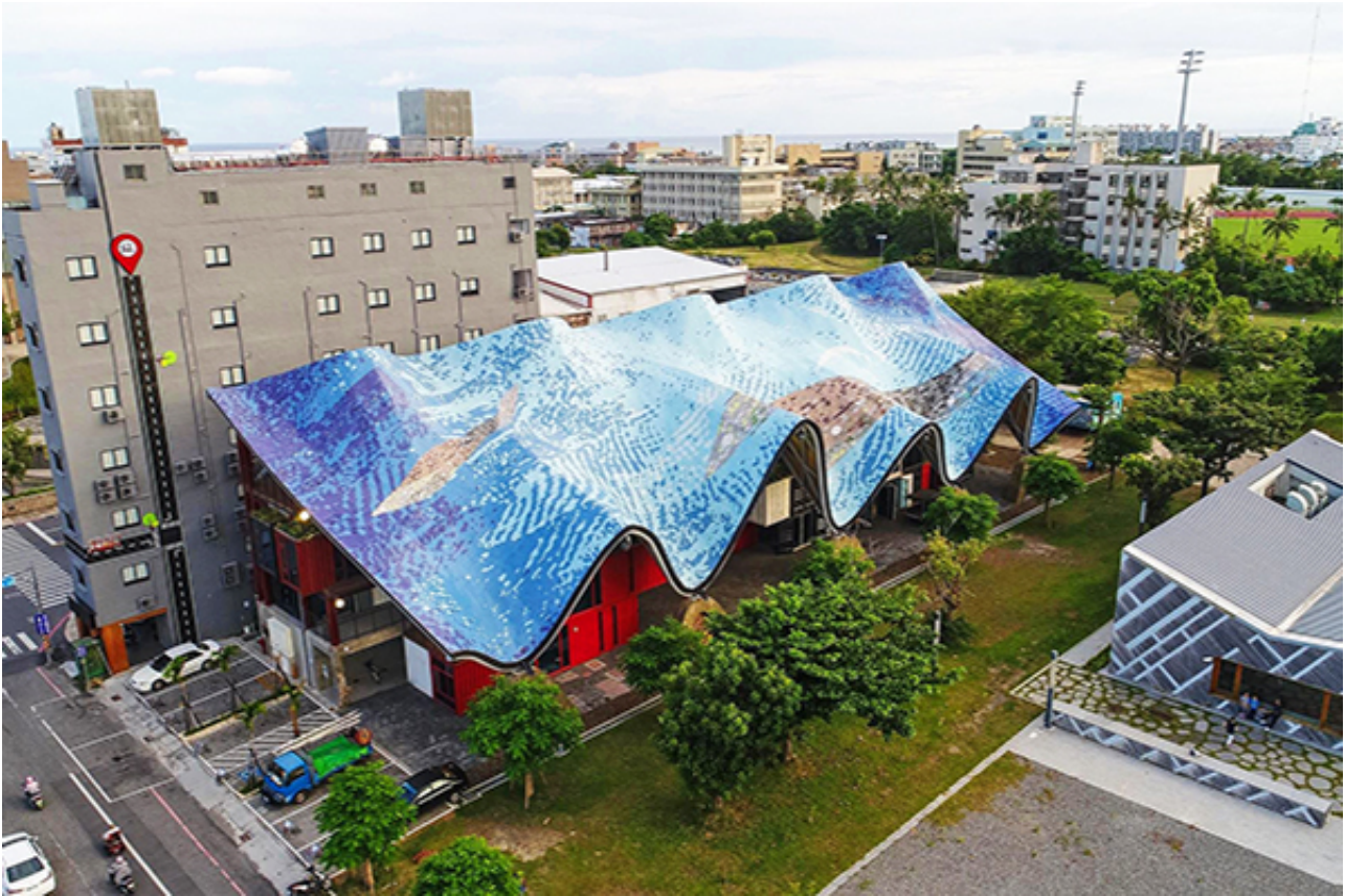
鐵花村打造了一處貨櫃屋新亮點。(圖／TTstyle 原創館)

TTstyle 原創館，波浪狀的壯觀外型，以 50 個貨櫃建造三層樓建築，裡面有許多傳承工藝的店家，將文創美學結合飲食與觀光文化，展現台東與鐵花村的新風格。